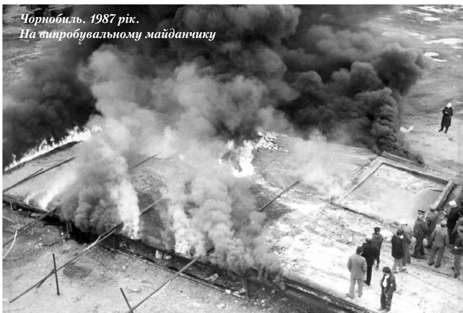
Чорнобиль. 1987 рік. На випробувальному майданчику