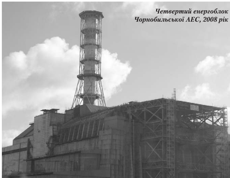
Четвертий енергоблок Чорнобильської АЕС, 2008 рік

"Зробити надможливе" – під таким гаслом тривала робота протягом усіх років на шляху подолання наслідків Чорнобильської катастрофи. Вочевидь, титанічних зусиль коштує фахівцям усіх рівнів повернення до життя радіоактивно забруднених земель, збереження екологічної рівноваги Зони відчуження і взагалі – подолання гуманітарних, економічних, соціальних та екологічних наслідків цього лиха