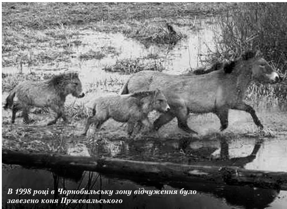
В 1998 році в Чорнобильську зону відчуження було завезено коня Пржевальського

З 1992 року в Зоні відчуження розпочалося поступове відновлення та стабілізація чисельності та структури фауністичних угруповань. За відносно невеликий проміжок часу чисельність великих ссавців дійшла до стану стабільної циклічності. Тобто, компоненти системи "хижак-жертва" набули рівноваги між собою. У 2000 році в результаті досліджень за державною програмою "Фауна" вченими Міжнародної радіоекологічної лабораторії "Чорнобильського центру", ДСНВП "Екоцентр", Інституту зоології та інших наукових закладів були отримані наступні дані чисельності основних видів великих ссавців на території Зони відчуження: вовк – більше 300 особин, рись – понад 18, дикий кабан – 3-4 тис., козуля – 2-3 тис., лось – не менше 1 500, олень європейський – до 200-300 особин, бобер річковий – 1-1,5 тис. Варто також зауважити, що інформацію про стан та процеси, які відбуваються в більшості основних груп фауни Зони відчуження, вченим доводилося добувати ско-