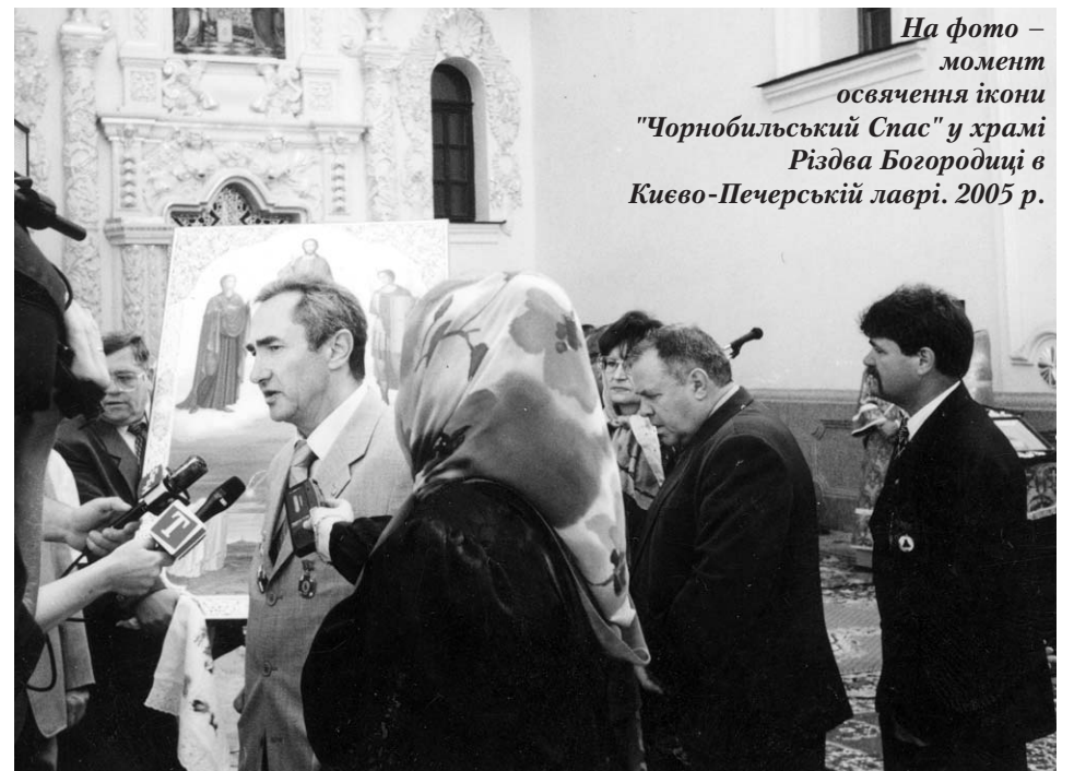
На фото – момент освячення ікони "Чорнобильський Спас" у храмі Різдва Богородиці в Києво-Печерській лаврі. 2005 р.

На жаль, зроблено багато помилок у Зоні відчуження... Необроблено, на основі політичного рішення, зупинили Чорнобильську станцію, яка коштує кілька мільярдів доларів. Хіба Україна настільки багата, щоб розкидатись такими сумами? Ось Литва невелика, але з характером, думає про власні інтереси. Захід, напевне, теж тиснув на неї, щоб зупинити Ігнолінську атомну станцію, яка була і є значно небезпечнішою за Чорнобильську. Проте Литва чомусь заявляє Заходу: ви нам спочатку збудуйте компенсуючі потужності, забезпечте нас резервами палива, виділіть гроші на зняття станції з експлуатації, бо ми своїми силами не здатні цього зробити... І досі Литва веде на своїй станції реконструктивні роботи, а ми, керуючись невідомо чіми інтересами, без підготовки (ще не була готова котельня, не побудоване сховище відпрацьованого палива і підприємство з переробки радіоактивних відходів) зупиняємо станцію, на якій зовсім не вироблений ресурс, а 3-й блок міг ще спокійно працювати півроку, бо мав ядерне паливо. Тож маємо тяжкі екологічні наслідки. Єдине – в минулому році МНС зробило, на наш погляд, якісний прорив у роботі із приведення Чорнобильської АЕС у безпечний стан, і станція насправді знята з експлуатації.