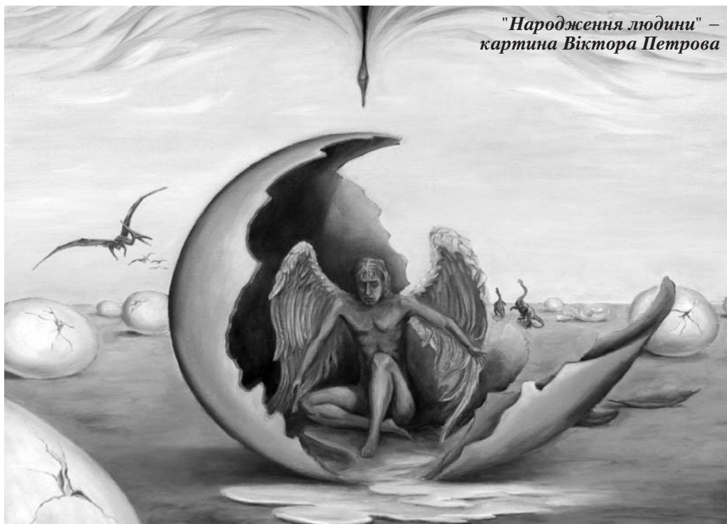
"Народження людини" – картина Віктора Петрова