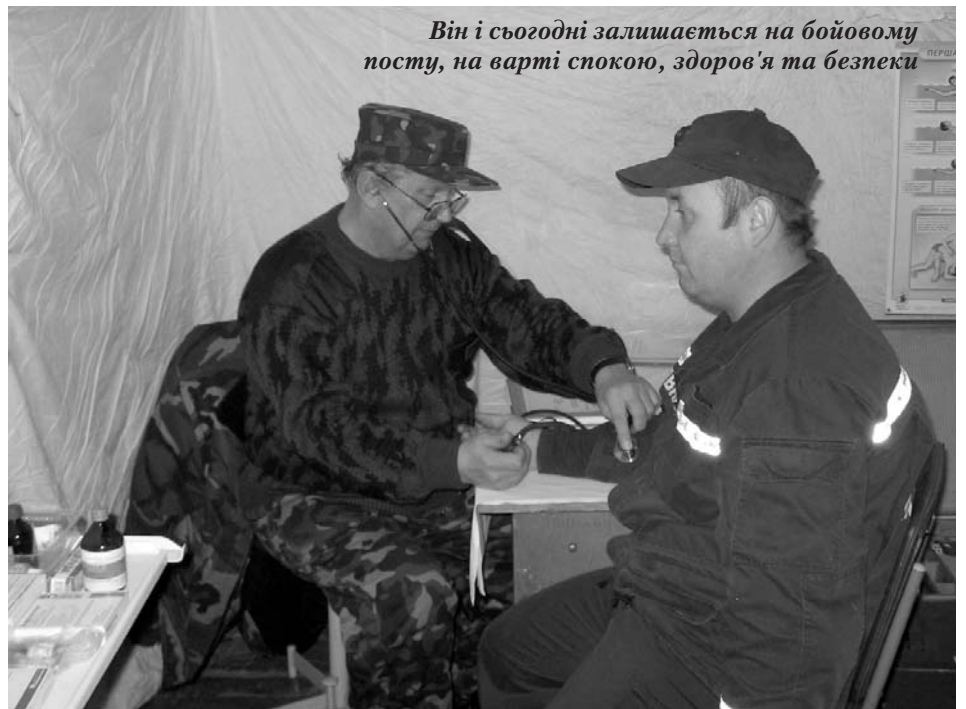
Він і сьогодні залишається на бойовому посту, на варті спокою, здоров'я та безпеки

Вже на новому місці йому, чорнобильському ветерану, довелося побачити та протистояти трагедії нового часу. В альбомі лікаря Шорохова, крім знімків з лекцій та заліків, щоденного надання допомоги бійцям МНС та